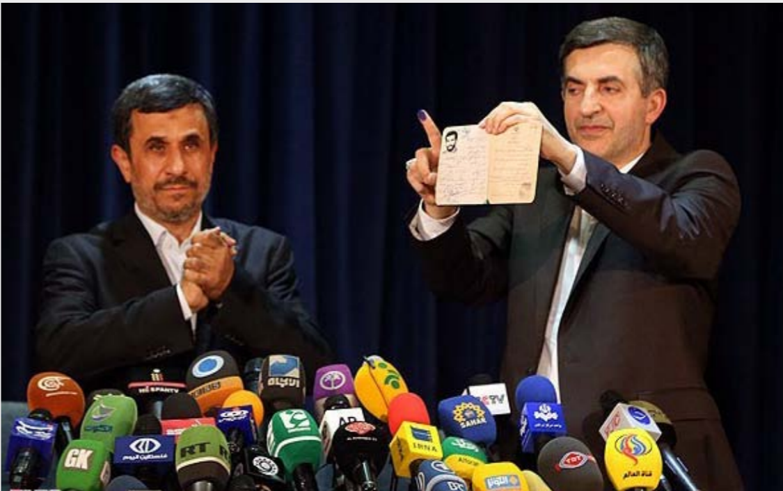
رئیس‌جمهور ایران، محمود احمدی‌نژاد، در جریان مراسم افتتاحیه کنگره جهانی علمای شیعه در تهران.

تا نزاع‌های جدایی طلبان و جنگ هشت ساله، تا غائله ۴۱ اسفند ۹۵ و نیز فرار مسعود رجوی و بنی‌صدر و همچنین عزل قائم مقام رهبری در سال‌های آغازین پس از پیروزی انقلاب تا رد صلاحیت گسترده نمایندگان و تحصن مجلس ششم و نیز آشوب‌های اجتماعی نظیر کوی دانشگاه. آخرین آن‌ها نیز به عنوان فتنه ۸۸ در تاریخ ثبت شد تا برگ افتخارآفرین دیگری باشد برای ملت